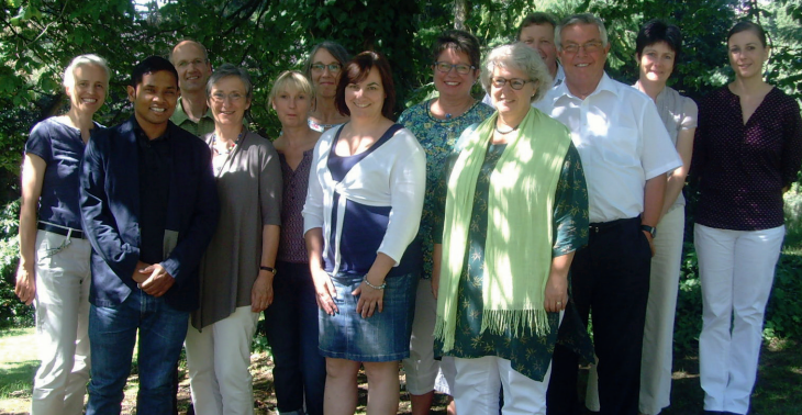
Unser Foto zeigt die Ethik-Beratungsgruppe.